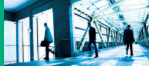
optimale veiligheid in openbare gebouwen