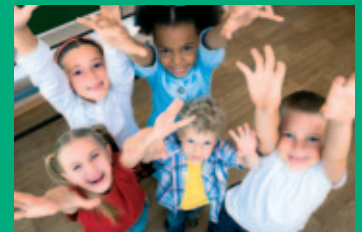
zien en gezien worden: een veiliger gevoel voor bezoekers en medewerkers