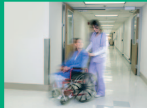
optimale bescherming van goederen, bedrijfs- en persoonsgegevens