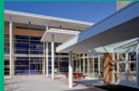
bescherming van goederen en gebouwen