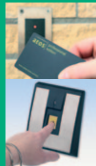
geavanceerde technieken met altijd de gebruiker en het gemak centraal