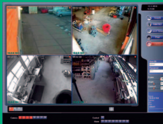
24-uurs controle via lokaal netwerk of internet